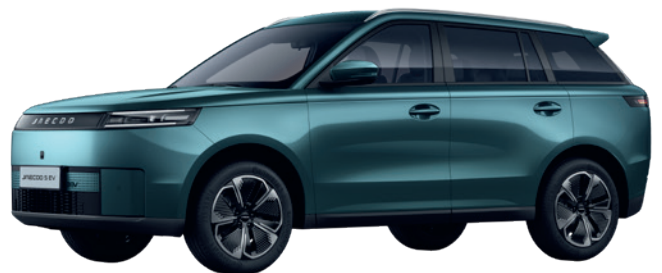
ALPESI ZÖLD (LQ)