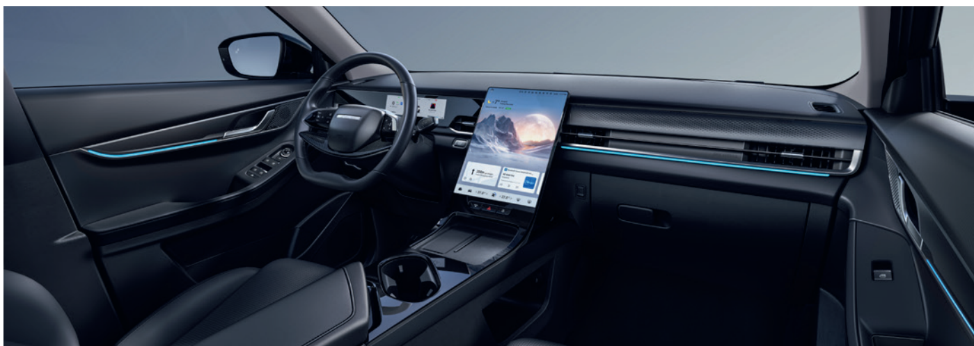
FEKETE SZINTETIKUS BŐR